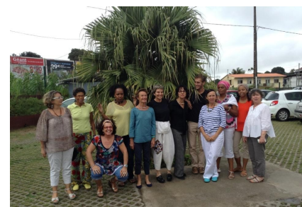
Les stagiaires et quelques formateurs

Nous prenons alors un temps avec l'équipe d'ALIVE pour un debriefing sur cette semaine de formation.