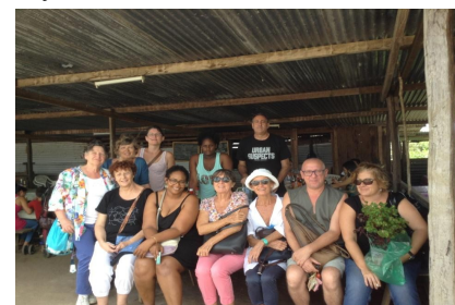
L'équipe de l'HAD Cayenne et d'ALIVE

Nous avons vraiment apprécié cet accueil chaleureux qui s'est poursuivi le week-end par une prise en charge par l'équipe HAD pour nous faire découvrir les plus beaux endroits de la Guyane.