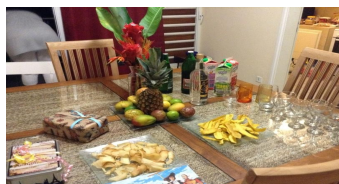
Aperçu de l'accueil guyanais

Elles nous accompagnent ensuite à la découverte de nos logements (2 appartements dans une petite résidence très sympa à 5 mn de l'HAD Cayenne). Sur la table de la salle à manger une coupe de fruits exotiques (petites bananes, fruits de la passion, mangues, ramboutans (sorte de litchis) a été déposé à notre attention, ainsi qu'un magnifique bouquet de fleurs de Guyane. Attention très appréciée de nous tous.