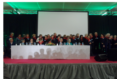
Les membres du CA de la Fédération et les bénévoles de JALMALV ORLÉANS